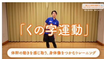
トレーニングの解説（8分）