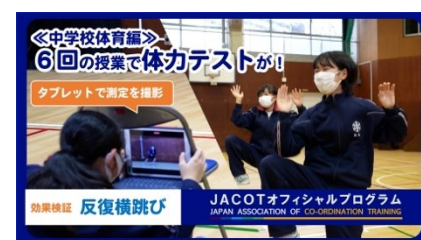
中学校1年生の体育授業（5分）