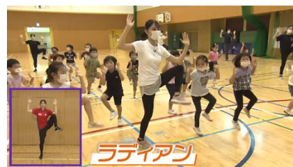
千代田区の取組紹介（7分）