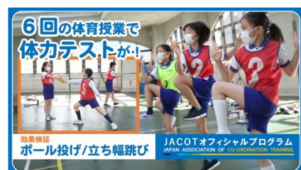
小学校5年生の体育授業（6分）