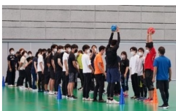
セミナーは実技中心