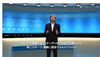
eラーニングは理論中心