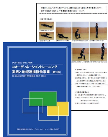
ライセンス教本 (150 頁) を使用