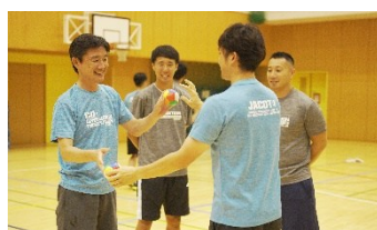
会場セミナー (実技中心)