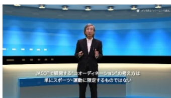
オンライン講座は理論中心