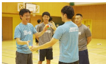
会場セミナーは実技中心