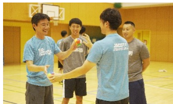
会場セミナーは実技中心