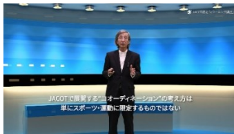
オンライン講座は理論中心