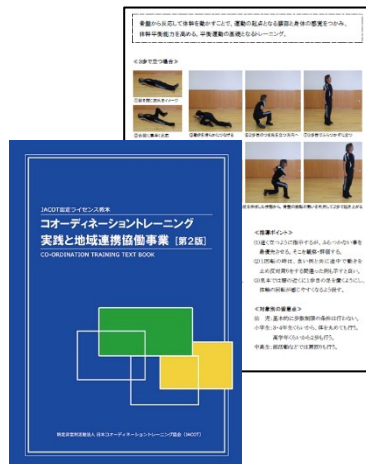
ライセンス教本（150頁）を使用